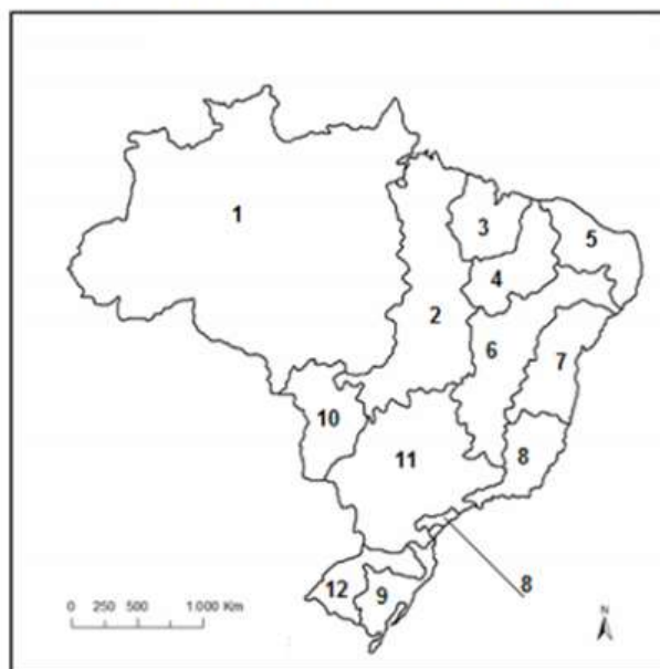
Bacias Hidrográficas Brasileiras

40. O Brasil é um país privilegiado quando o assunto é disponibilidade de água-doce – 14% das reservas mundiais de água-doce estão no território brasileiro. De acordo com o Instituto Brasileiro de Geografia e Estatística (IBGE) e o Conselho Nacional de Recursos Hídricos (CNRH), o país possui 12 bacias hidrográficas, que estão distribuídas por todo o território nacional.