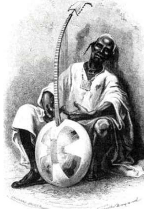
Griot, contador de história, em imagem datada de 1868.

35. Observe as imagens, leia os fragmentos dos textos abaixo e responda: